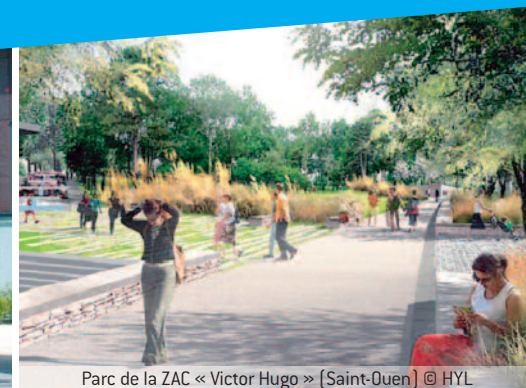
Parc de la ZAC « Victor Hugo » (Saint-Ouen)