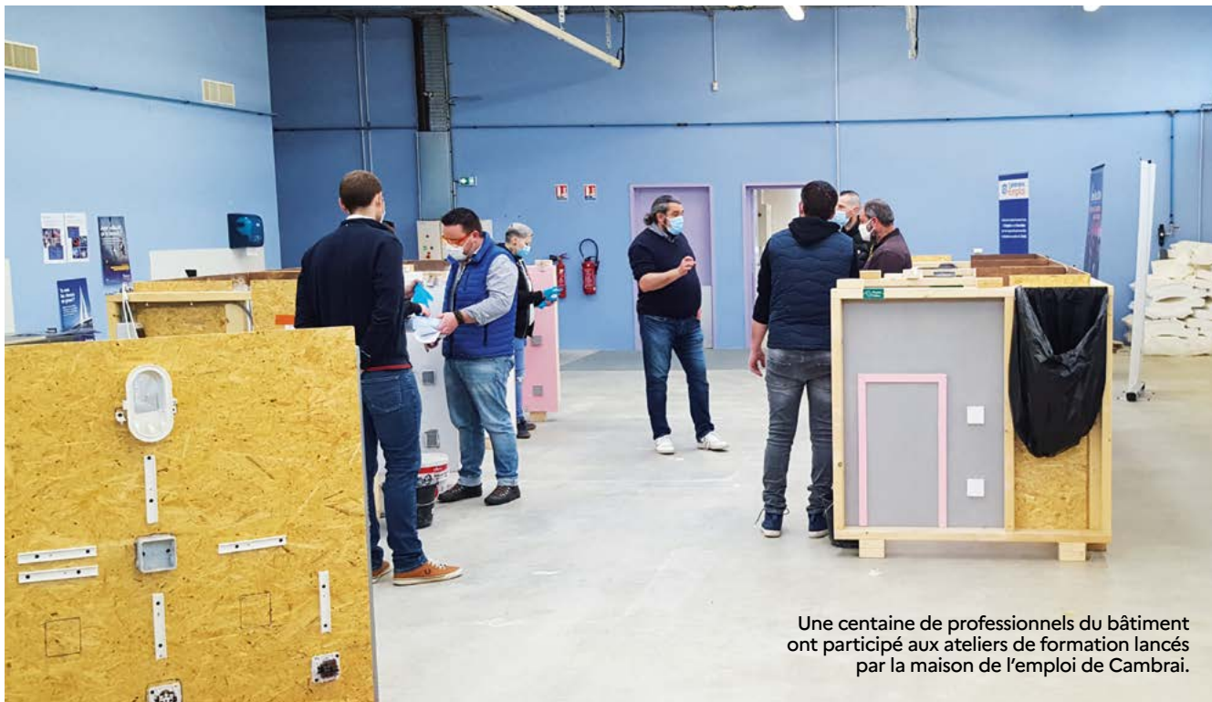
Une centaine de professionnels du bâtiment ont participé aux ateliers de formation lancés par la maison de l'emploi de Cambrai.