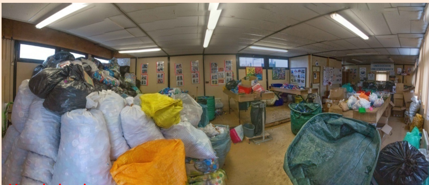
Vue du local

Notre association est reconnue d'intérêt général, déclarée à la Préfecture de l'Essonne n° W0912002219 le 17/12/2004, au journal officiel le 22/01/2005 Siren n°497677914 00036