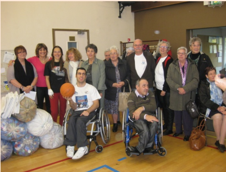
Fauteuil de sport